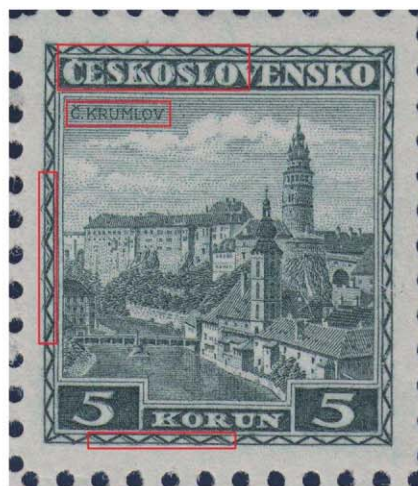
Obr. 5 Dvojitá moletáž na 2. ZP 100 ks archu tlačovej dosky 1A