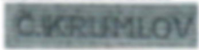
Obr. 2 Dvojitá moletáž nadpisu Č.KRUMLOV – šikmo nadol postupujúca

Prvá emisia známok stredného formátu vytlačená rotačnou ocelotlačou. Známkami boli vydané ustanovením č. 65/1931 VMPT č.59 v januári 1932 ([1]). Nominálne hodnoty známok 4Kč a 5Kč nahradili známky predchádzajúceho vydania (Praha, Tatry 1926), ktorého ocelotlač z plochých dosiek bola nákladnejšia. Známkou 5Kč s obrazom Českého Krumlova bola vytlačená v machovo zelenej farbe a vo vysokom náklade 4,55 milióna kusov. Platnosť známok tejto emisie skončila 15.marca 1937, keď ju nahradili známky emisie Krajiny, hrady a mestá 1936.