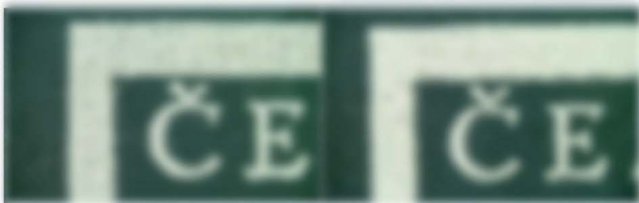
Pravý druh prvního typu