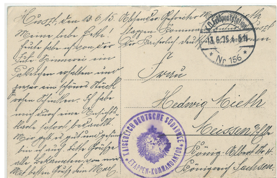
Obr. 8. Pohlednice, odeslaná z etapního velitelství DSA prostřednictvím stanice polní pošty 156. Datováno odesílatelem Huszt 16. 6. 1915.