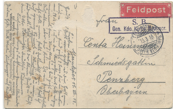
Obr. 6. Pohlednice Mukačeva s denním razítkem polní pošty a útvarovým razítkem generálního velitelství AK Bothmer. Datováno odesílatelem Munkács 15. 3. 1915.