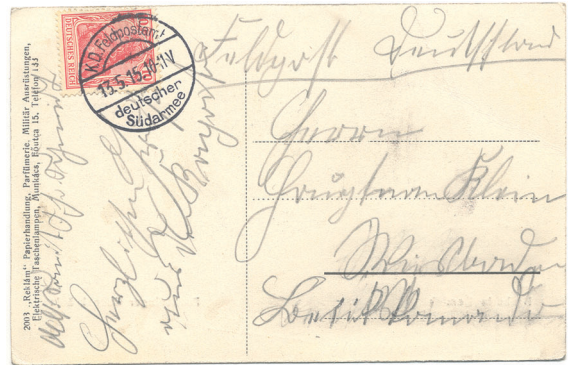
Obr. 4. Definitivní denní razítko polní pošty DSA použité 13. 5. 1915 na frankované pohlednici Podhoran u Mukačeva. Vzácné použití německé známky na území Podkarpatské Rusi.