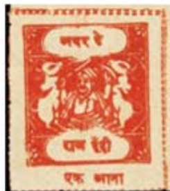
Obr. 23 Vydání pro červený kříž

Býly přetiskované známky se všemi typy nápisů a pro přetisky bylo použito několik barev. Nejčastěji je barva černá, následovaná barvou červenou a nejméně často je barva zelená. Přetisky existují ve všech možných variantách – ležané, dvojitě, převrácené, vymechnuté ve dvojitě, apod. Známeček apod., které si však nezaujmají větší cenovou přízeň. Je nutné zdůraznit, že celý vydání má hodně spekulativní charakter, protože bylo běžné obchodní korespondenci přepravovat zdarma. I tak málo skutečně poštovní použití emise měla, existuje však jen jediný celý dopis.