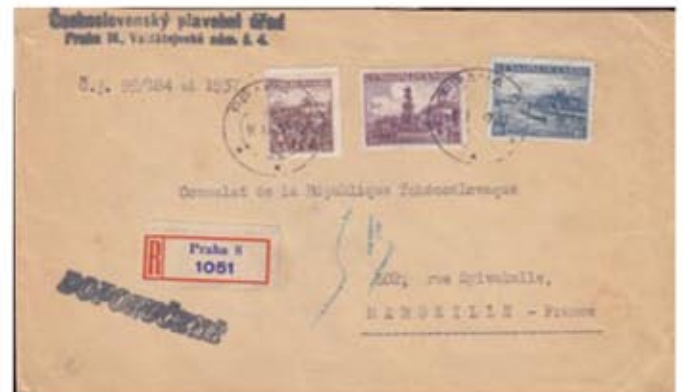
Obr. 7 Ťažký doporučený úradný list zaslaný z Prahy 8 10.XI.37 do prístavného mesta Marseille

Opačná situácia, čo sa týka vzácnosti celistvosti, je pri ťažkom doporučenom firemnom liste zaslanom na konzulát ČSR v Marseille na obr. 7. Znovu sa jedná o 3-farebnú frankatúru ale podstatne vzácnejšiu. Celkové poštovné vo výške 17 Kč sa skladalo z poplatkov za doporučený list do vzdialenej cudziny (2,50 Kč + 2,50 Kč) a príplatku za zvýšenú hmotnosť zásielky do 180 gramov (8 x 1,50 Kč).