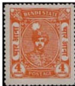
Obr. 28 a 29 Portrét panovníka a krajina Búndí

Na poslední emise (1947) je vyobrazen patronník a na části série také krajina Búndí.