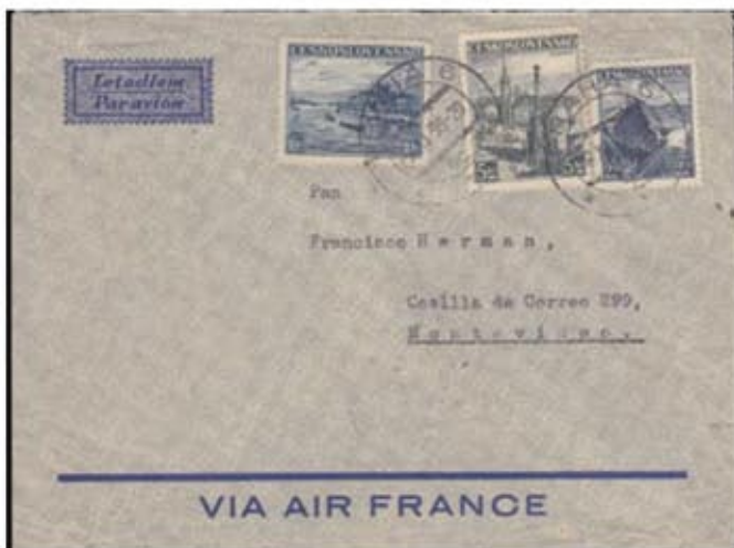
Obr. 6 Obyčajný letecký list do Uruguaja dopravený francúzskou leteckou poštou – špeciálna letecká obálka

Expresný letecký list do Buenos Aires (obr. 5) je upravený frankatúrou v celkovej výške 126,50 Kč (2,50 Kč list do vzdialenej cudziny + 2,50 Kč dopravný poplatok + 1,50 Kč poplatok za zvýšenú hmotnosť listu + 20 gramov + 8 x 15,- Kč letecký poplatok do Argentíny). Poštár 20 miliónov hodnoty 20 Kč na poštovej celistvosti je výnimkou. List bol dopravený do Južnej Ameriky nemeckou leteckou poštou cez Stuttgart (menej časť gumová fólia pečiatka DEUTSCHE LUFTPOST * EUROPA SÜDAMERIKA). Doručenie listu do Argentíny je potvrdené iba doplnkovou pečiatkou CERTIFICADOS * CENTRAL * 23 na prednej strane obálky.