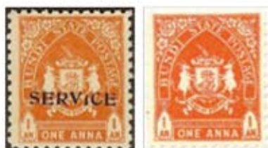
Obr. 26 a 27 Normální a služební známka emise z roku 1941

Pro vydání emise „Dus-Itne kavy“ byly ještě vydány 2 další emise. První z nich je emise se státním erbem. Bylo vydáno 1941, celkem 7 hodnot, zatím v blocích po 12 známkách. Pro služební účely byly přetiskovány „SERVICE“.