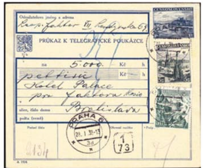
Obr. 8 Preukázka k telegrafickej poukážke na 5.000 Kč, podacia pošta PRAHA 6,28.I.38-13

Na obr. 8 je preukázka k telegrafickej poukážke (suma 5.000 Kč) zaslaná z PRAHY 6 28.I.1938 do Bratislavy. Na záduň strane preukázka je uvedená nasledovná ponuka: „Na tento príkaz nemôže byť vyplatený peniaz; výplata a uspokojenie sa prevádza len na stranu (čís. 172) nariadenia postovním úradom podľa dohody podnikateľského telegramu a podnikavca prijímateľ“. Tento postoj sa odporúča aj každý zápis výplacieho termínu až 28.I. na záduň strane preukázky, hoci on sám bol doručený do Bratislavy až 29.I.38-8.