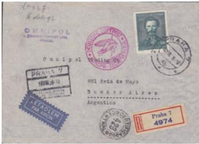
Obr. 5 Letecký doporučený firemní list do Argentíny, podacia pošta PRAHA 7 10. VIII. 38

Expresný letecký list do Buenos Aires (obr. 5) je upravený frankatúrou v celkovej výške 126,50 Kč (2,50 Kč list do vzdialenej cudziny + 2,50 Kč dopravný poplatok + 1,50 Kč poplatok za zvýšenú hmotnosť listu + 20 gramov + 8 x 15,- Kč letecký poplatok do Argentíny). Poštár 20 miliónov hodnoty 20 Kč na poštovej celistvosti je výnimkou. List bol dopravený do Južnej Ameriky nemeckou leteckou poštou cez Stuttgart (menej časť gumová fólia pečiatka DEUTSCHE LUFTPOST * EUROPA SÜDAMERIKA). Doručenie listu do Argentíny je potvrdené iba doplnkovou pečiatkou CERTIFICADOS * CENTRAL * 23 na prednej strane obálky.