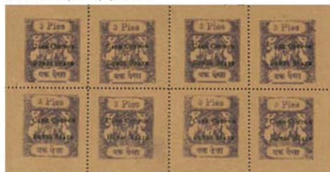
Obr. 24 Celý tiskový arch cash couponu nominále 3 paisy

Stejného obrazu bylo provizorně také použito pro nouzové peníze, tzv. cash coupons. Horní štítek má nyní hodnotu nominále v latince a dolní nominál v Devanágári. S tímto obrazem byly vydány 2 hodnoty – 3 paisy a 1 anna. Je zajímavé, že obě hodnoty byly vytisknuty z jiného uspořádání tiskové desky. Hodnota 3 paisy byla vytisknuta v 8-blocích a 1 anna ve vodorovných čtyřpáskách.