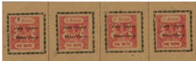
Obr. 25 Celý tiskový arch cash couponu nominále 1 anna