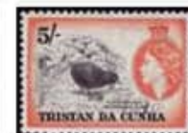
Obr. 113 Nelietavý fták - chiašťel vodný