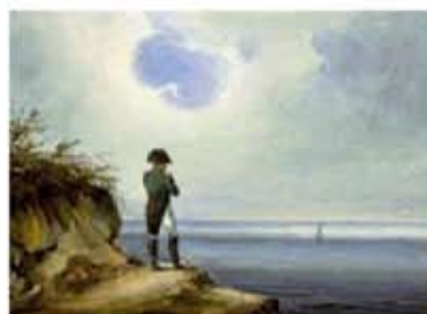
Obr. 95 Napoleon na Svätej Helene