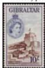
Obr. 93 Veža Maur. hradu

Svätá Helena, Ascension a Tristan da Cunha (Saint Helena, Ascension and Tristan da Cunha) sú severojužne navzájom od seba dosť vzdialené ostrovy sopečného pôvodu v južnom Atlantiku. Ich celková rozloha aj s pridrúženými ostrovčekmi je 420 km 2 . Ležia skoro uprostred medzi Afrikou a Južnou Amerikou. Ostrovy Ascension a Tristan da Cunha sú dependenciami ostrova Svätá Helena a spolu s ním tvoria jedno zámorské územie Spojeného kráľovstva. Aj obidve dependencie vydávajú vlastné poštové známky.