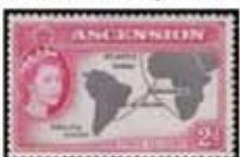
Obr. 108 Mapa kábl. siete