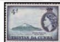
Obr. 112 Pohľad na ostrov z juhozápadu