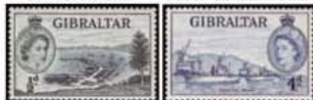
Obr. 91 Nákladný a osobný prístav Obr. 92 Uhoľný prístav