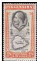
Obr. 104 Mapa