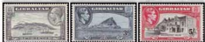
Obr. 88 Gibraltár Obr. 89 Gibraltár – skala Obr. 90 Sídlo guvernéra