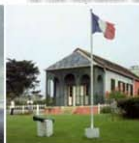
Obr. 96 Napoleonova rezidencia