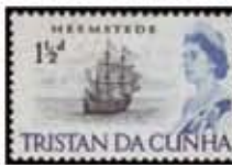
Obr. 116 Hol.-Východoindická loď „Heemstede“

ostrovov. Najbližšie na 37° juhu a 17° západne (27). Hlavnou obľúbenou a najväčšou z nich je Tristan da Cunha (obrázok 110) s rozlohou 56 km 2 a populáciou 260 obyvateľov. Druhým najväčším ostrovom je Gough Island s rozlohou 36 km 2 a populáciou 30 obyvateľov. Tretím najväčším ostrovom je Inaccessible Island s rozlohou 26 km 2 a populáciou 30 obyvateľov. Ostatné ostrovy sú: Middle Island (10 km 2 ), Nightingale Island (10 km 2 ), Tropic Island (10 km 2 ), Assorted Islands (10 km 2 ), a Bird Island (10 km 2 ). Všetky ostrovy sú súčasťou územia Tristan da Cunha, ktoré je súčasťou Spojeného kráľovstva.