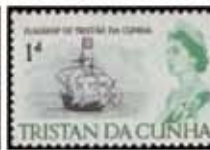
Obr. 115 Vlajková loď admirála T. da Cunha