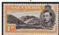
Obr. 105 Green Mountain