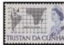
Obr. 114 Mapa ostrova v Atlantiku