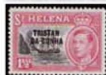
Obr. 111 Pretlačové vydanie (zn. Sv. Helena)

ostrovov. Najbližšie na 37° juhu a 17° západne (27). Hlavnou obľúbenou a najväčšou z nich je Tristan da Cunha (obrázok 110) s rozlohou 56 km 2 a populáciou 260 obyvateľov. Druhým najväčším ostrovom je Gough Island s rozlohou 36 km 2 a populáciou 30 obyvateľov. Tretím najväčším ostrovom je Inaccessible Island s rozlohou 26 km 2 a populáciou 30 obyvateľov. Ostatné ostrovy sú: Middle Island (10 km 2 ), Nightingale Island (10 km 2 ), Tropic Island (10 km 2 ), Assorted Islands (10 km 2 ), a Bird Island (10 km 2 ). Všetky ostrovy sú súčasťou územia Tristan da Cunha, ktoré je súčasťou Spojeného kráľovstva.