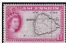
Obr. 106 Mapa ostrova