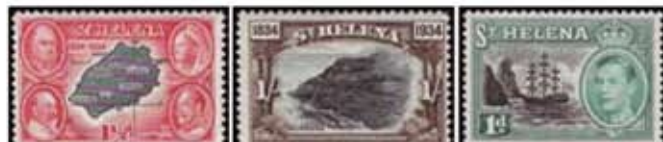
Obr. 97 Mapa ostrova Obr. 98 Útes Mundens Obr. 99 Symbol ostrova