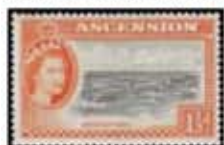
Obr. 107 Georgetown