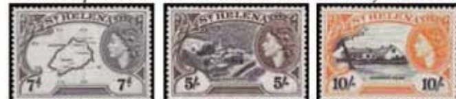
Obr. 100 Mapa ostrova Obr. 101 Jamestown Obr. 102 Longwood House