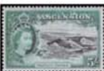
Obr. 109 Dokonalý kráter