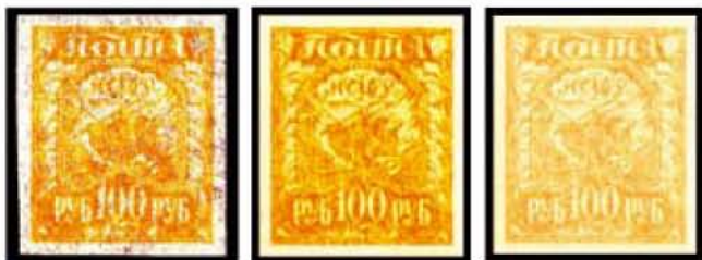
Obr. 70. Barvy známky „Zemědělství“ z 1. výplatní emise známek RSFSR Mi 156

Mnoho známek je známo i v několika barevných odstínech . To představuje jistý problém: tyto odstíny jsou totiž v katalogích popsány jen slovně, takže je těžké určit správný odstín, zejména je-li k dispozici jen jedna či jen několik málo známek, což je u vzácnějších známek běžné. Jsou-li mezi odstíny i velké rozdíly cenové, mohou se názory prodávajícího a kupujícího i diametrálně lišit. Uvedme jako příklad 100rublovou známku „Zemědělství“ z 1. výplatní emise známek RSFSR „Symboly práce“ z roku 1921 (obr. 70):