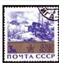
Obr. 71. Hodnotový štítek zlatý (Mi 3053).