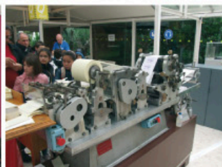
Obr. 3 Děti pozorují tisk známek na rotačním stroji

Výstava byla organizována společně s Mezinárodní filatelistickou výstavou (FIP) a Mezinárodní výstavou poštovních známek (IPE). Výstava byla rozdělena do tří částí: Právní dějiny poštovní služby, Filatelie a Poštovní služby.