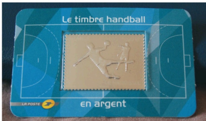
Obr. 7 Stříbrná známka „Handball“