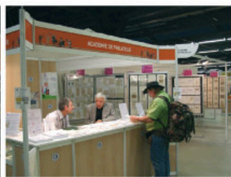
Obr. 11 Stánek Francouzské filatelické akademie. Znalecké konzultace.

Text of the article, partially obscured and blurry.