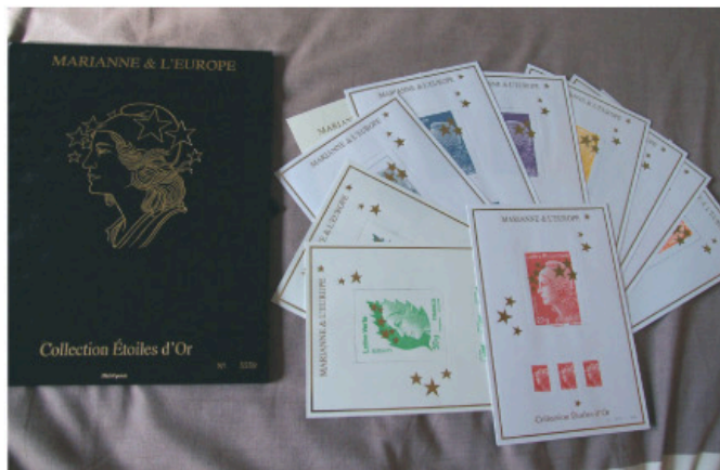
Obr. 6 Soubor aršíků se známkami s obrazem Marianny