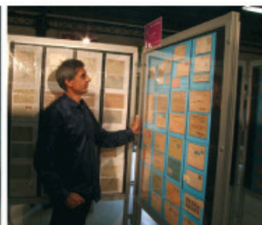
Obr. 8 Pohled do výstavního sálu. Řady rámičů pro exponáty