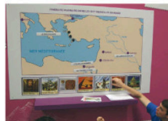
Obr. 2 Děti hledají na známkách 7 divů světa

Prostřední prostor pro obchodníky, poštovní správy a francouzskou poštu byl ve středu velkého pavilonu. Francouzská pošta tuto plochu ovládala. Bylo zde možno koupit až neskutečné množství známek a dalšího filatelistického materiálu. Bylo zde dokonce několik prodejních míst, netvořily se fronty a filatelisté měli dostatek prostoru a klidu si kulturně nakoupit, co se jim líbí. Vzpomněl jsem si na výstavu PRA-GA 2008, kde naše pošta nevyužila ani takovou velkou událost. Bylo tam otevřeno málo přepážek, u nichž zpacení filatelisté, namačkaní v dlouhých frontách, trpělivě vystávali v nepříjemném neklimatizovaném prostředí zanečně dlouhou dobu. Francouzská pošta však umí dobře organizovat obchod se známkami, zřejmě lépe než my.