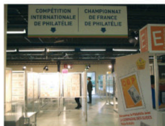
Obr. 10 Exponáty Národní třídy – mistrovství Francie