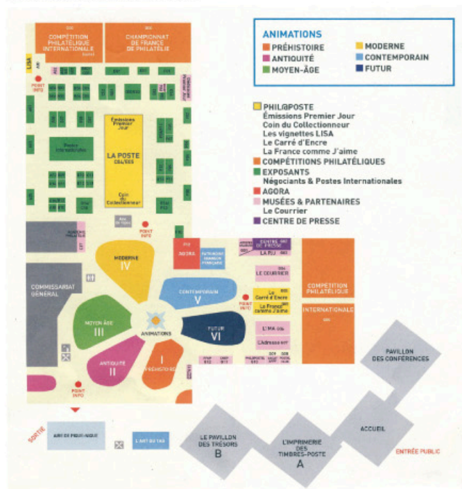
Obr. 1 Plán výstavního areálu

Výstava byla instalována ve velkém pavilonu, v němž byl prostor rozdělen do tří částí (obr. 1):