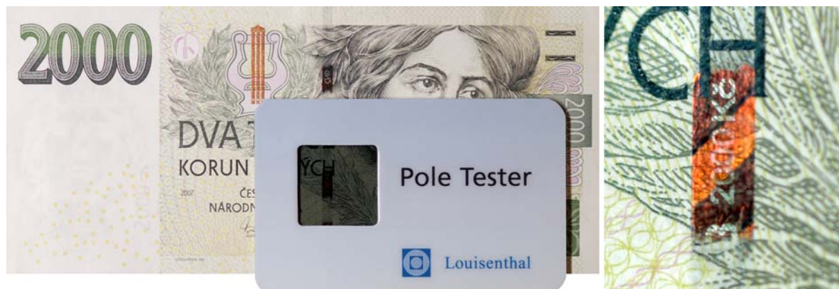
POLE efekt ochranného proužku

ochranným proužkem šířky 3 mm s opakujícím se šrafovaným negativním mikrotextem ČNB 2000 Kč, který svoji kovově lesklou barvu mění v závislosti na úhlu dopadu světla z hnědofialové na zelenou.