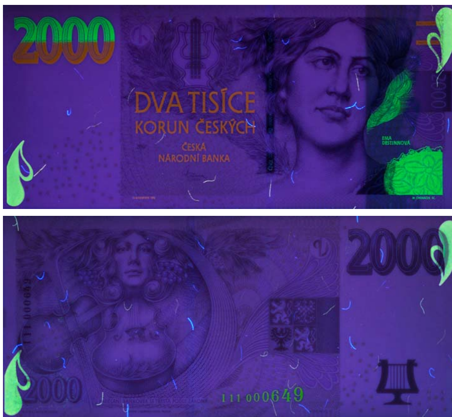
Líc a rub bankovky v ultrafialovém světle.

Další novinkou je také tzv. POLE efekt ochranného proužku. Po přiložení pomůcky zvané POLE tester se na ochranném proužku projeví efekt POLE prvku v podobě šrafování světlejšími a tmavšími částmi ve tvaru kosodélníků.