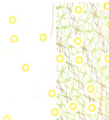
Další designérské úpravy

Nová bankovka je stejného rozměru jako předcházející vzory a má shodné základní parametry včetně druhu papíru. Vodoznak v průsvitu proti světlu tvoří nadále portrét Emy Destiniové, který je však doplněn tzv. elektrotypickým vodoznakem v podobě negativní (běločaré) číslice 2000 s drobným ornamentem připomínajícím péřovou ozdobu. Na líci nese bankovka letopočet 2007, faksimile podpisu „Tůma“ vytištěné tiskem s plochy (na dosavadních vzorech tiskem z hloubky) a na obou stranách další designérské úpravy, z nichž nejnápadnější je doplnění žlutých kroužků v dolní části okraje (kuponu) a v částech tiskového obrazce.