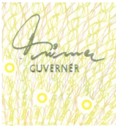
Podpis guvernéra ČNB