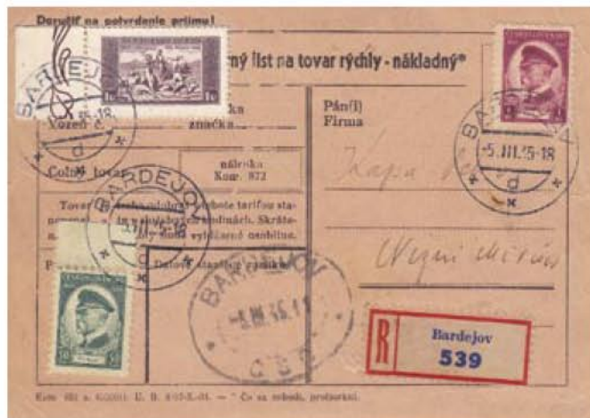
Obr. 5 Úradný nákladný list zo stanice Bardejov so známku 1 Kč z ľavého okraja hárčeka

Úradné použitie emisie KDM dokumentuje aj odberný list z obr. 5. Zmiešaná frankatúra emisií KDM a emisie 85. narodeniny T.G. Masaryka pochádza z 5. dňa platnosti emisie TGM.