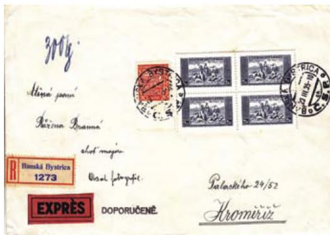
Obr. 7 Ťažký doporučený expresný list s obsahom fotografií zaslaný z Banskej Bystrice