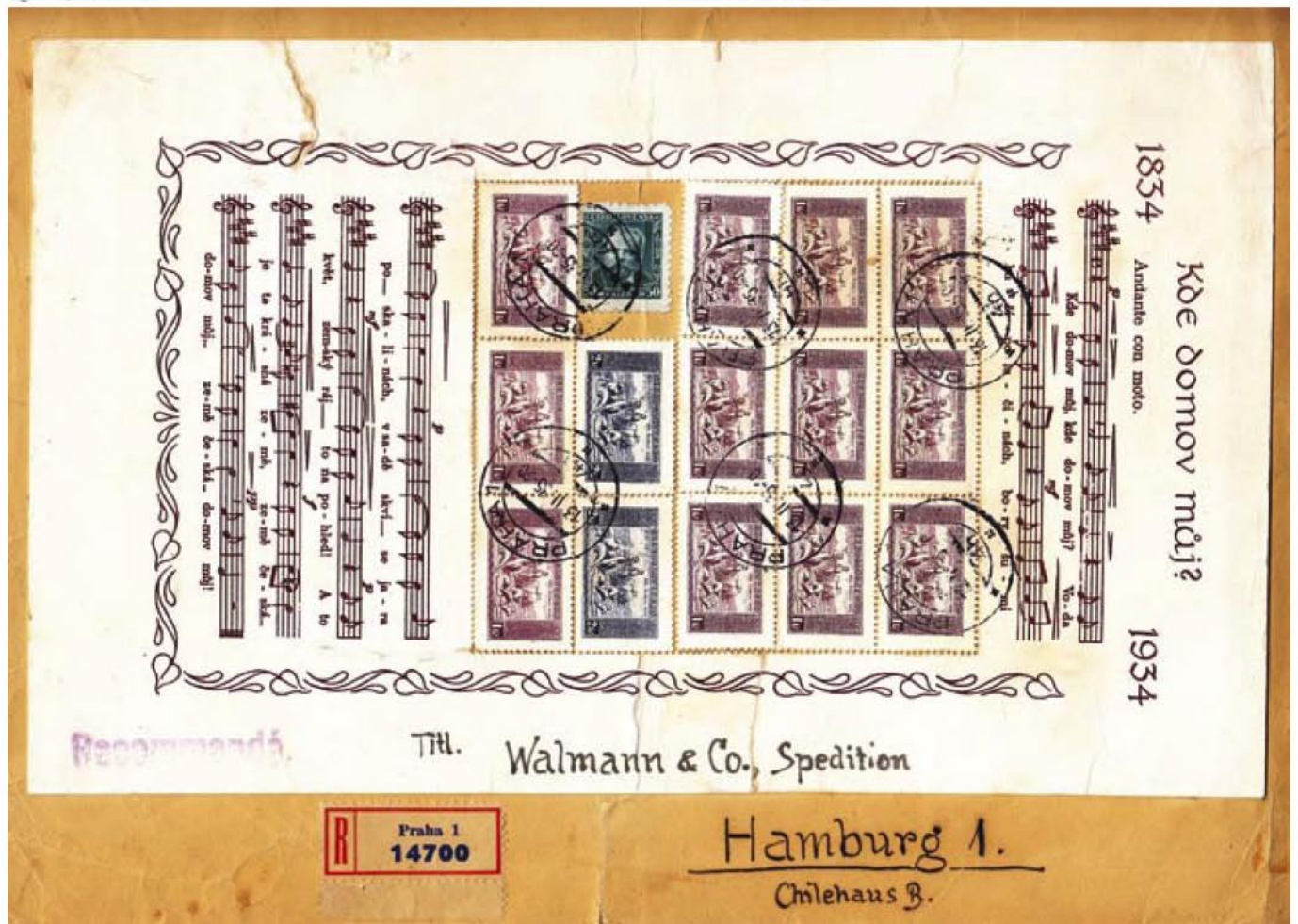
Obr.1 Koláž známok 1 Kč (9 x úzky formát, 3 x široký formát) a 2 Kč (2 x úzky formát)

Známky boli vydané 17. 12. 1934, teda 4 dni pred 100. výročím vzniku prvej listiny označenej prvou českou (okrajovou) úradnou listinou. Zároveň bol vydaný v dvoch nominálnych hodnotách 1 a 2 Kč a to v archívnej ako aj hářčekovej úprave a 15 tak označených. Prázdny vzorec bol tiež vydaný listinou úradnou prvou a spravidlom Karol Křížem. Zároveň bol vydaný v dvoch úradných úpravách a označených ako 1 a 2 Kč.