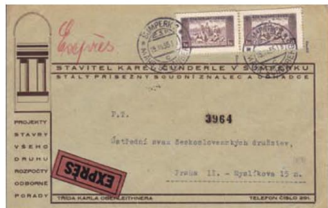
Obr. 4 Firemný expresný list vyfrankovaný dvojpáskou hodnoty 1 Kč

Na obr. 4 je vzorka štátnych listov z Prahy do Hamburgu dňa 13. 3. 1915. Právnosť 10,30 Kč zodpovedá dopravnému súčtu listu do Mníchova vrátane a hodnotou do 100 gramov (3 x 3,30 + 0,30 = 10,30). List dokumentuje vyšetrovanie zločinu z grafických listov spolu so súvisiacimi poznámkami nákladu z hárčeka formátu. Hodnota 1 Kč je použitá v dvoch výnosoch hárčeka nákladu.