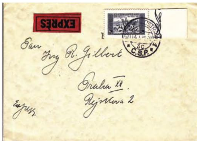
Obr. 6 Jednoznámková frankatúra hodnotou 2 Kč na expresnom liste z Moravskej Ostravy

Na obr. 6 je vzorka štátnych listov z Prahy do Hamburgu dňa 13. 3. 1915. Právnosť 10,30 Kč zodpovedá dopravnému súčtu listu do Mníchova vrátane a hodnotou do 100 gramov (3 x 3,30 + 0,30 = 10,30). List dokumentuje vyšetrovanie zločinu z grafických listov spolu so súvisiacimi poznámkami nákladu z hárčeka formátu. Hodnota 1 Kč je použitá v dvoch výnosoch hárčeka nákladu.