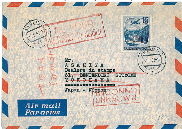
Obr. 16 Běžný, nefilatelický dopis z Hodonína do Yokohamy.

20 Kčs zejména z důvodů potřeby známek vyšších hodnot, a to nejvíce v období měnové reformy 1. – 18. 6. 1953 . Tehdy byly zásoby známek této emise na poštách spotřebovány prakticky až do posledního kusu.