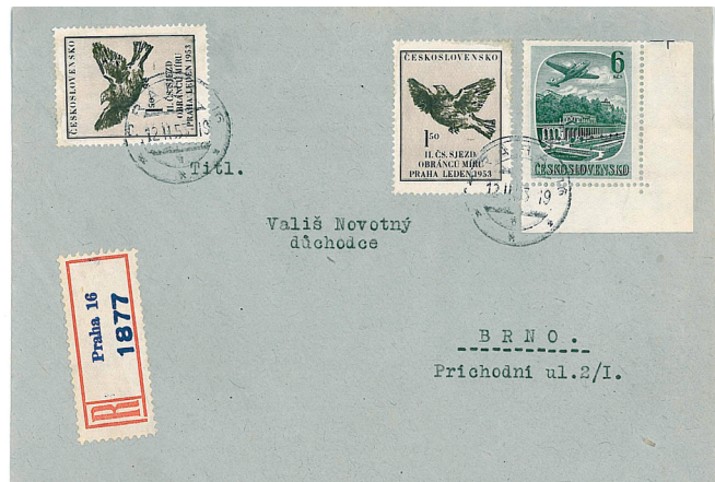
Obr. 17 Doporučený dopis se smíšenou frankaturou známek příležitostných (Pof. 700) a známky letecké (Pof. L33)