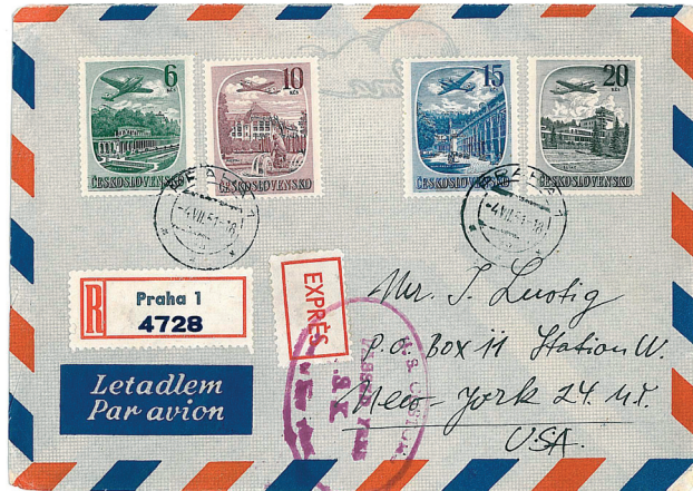
Obr. 15 Filatelicky frankovaný dopis z Prahy do New Yorku.

s nejkratší dobou platnosti (s výjimkou I. přetiskové emise). Poštovně použité je nalézáme navzdory nevelkému nákladu a krátké době platnosti relativně hodně. Na poštách se vyskytovaly dost pravidelně (kromě hodnoty