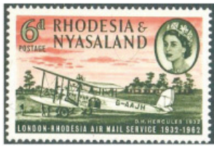
Obr. 7 – Letoun DH 66 City of Basra (G – AAJH) na známce Rhodézie a Njaska, vydané v r.1962 k 30. výročí otevření africké linky.