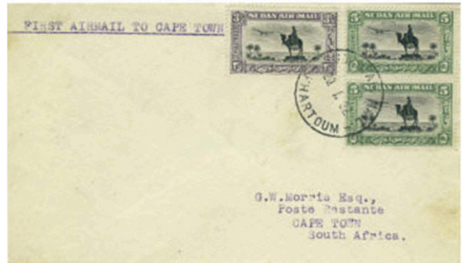
Obr. 10 – Letecká zásilka, dopravená otváracím letem africké linky IA na úseku Chartúm – Kapské Město v lednu 1932.