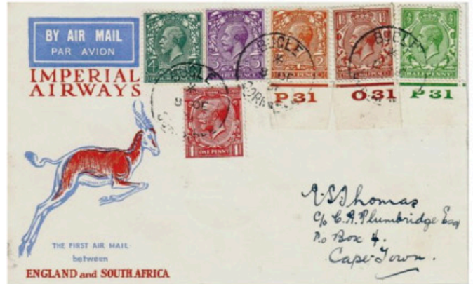
Obr. 8 – Letecká zásilka, dopravená tzv. vánočním letem z anglického Bugle do Kapského Města letounem DH 66 City of Cairo (G – EBMV). Výplátné 1 Sh (součet hodnot šesti vylepených známek).