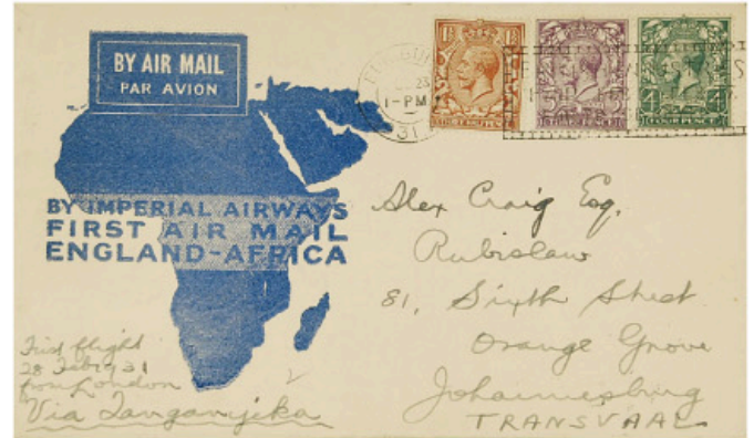
Obr. 1 - Letecká zásilka, dopravená zpátečním otvíracím letem první africké linky IA z Londýna do Johannesburgu přes Chartum a Kisumu. Výplatné 60c. (1931)