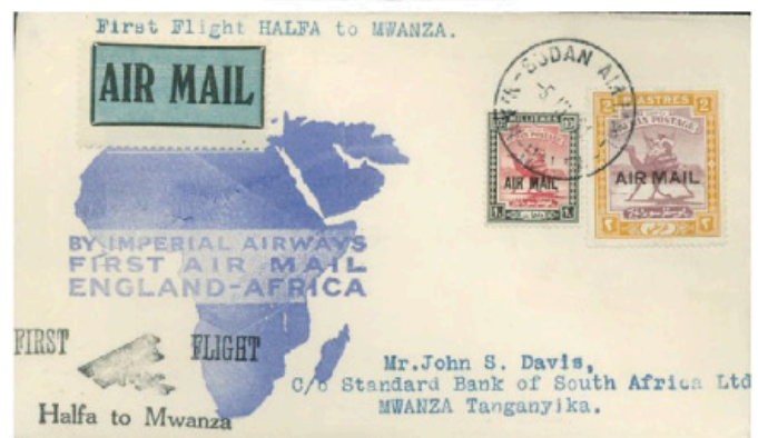
Obr. 3 - Letecká zásilka, dopravená zpátečním otvíracím letem první africké linky IA z Halfa do Mwanzy přes Chartum. Výplatné 60c. (1932)