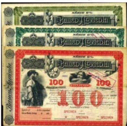
Chile: Banco Agrícola

Jak uvádí Hessler, v roce 1883, tedy pouhých 9 let po vzniku velké rytiny, vyryl G.F.C. Smillie oříznutou verzi rytiny. I když jde samozřejmě o nové dílo, jedná se v podstatě opravdu jen o ořez velké rytiny. Až na případné drobné odchylky v některých liniích byly kompozice i výraz obličejů obou postav zachovány. Tato rytina – „The Reapers No. 3“ se opět objevuje na mnoha cenných papírech.