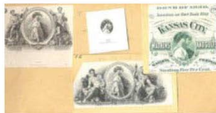
Sada otisků rytin použitých na cenných papírech, Archives International Auctions, říjen 2007, pol. 1548