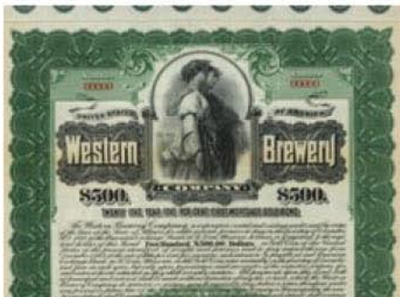
USA: Western Brewery