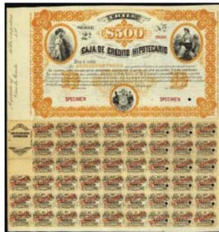
Chile: Caja de Crédito Hipotecario

Ve použití rytiny na cenných papírech přitom vidíme rovněž významné jiné o využití motivu silněji rytiny jako takové. Je pravděpodobné, že při přípravě konkrétního cenného papíru byla vytvořena vždy nová rytina, která rovněž obsahovala motivu sádkového grafika. Tento ostatně naznačují i dochované otisky takových