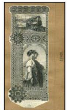
Otisk rytiny použitý na akci ze sady 12 otisků rytin s tímto motivem, Archives International Auctions, únor 2007, pol. 2040

V některých případech byla velká rytina oříznuta tak, že tvoří design rytiny „The Reapers No. 3“. Příkladem může být dluhopis $1000 The New York and Putnam Railroad Company z roku 1895.