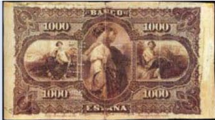
1000 pesetas, El Banco de España, Španělsko

Rytina většího formátu však našla využití zejména na celé řadě cenných papírů, a to převážně formou ze Spojených států, i když jsou známy výskyty i na akcích formou z některých latinskoamerických zemí. Prvnějším nám známým použitím je na akci Minneapolis-Moline Company z roku 1883. V následující tabulce uvádíme jen některé další příklady. 120