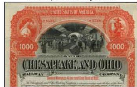
USA: The Chesapeake and Ohio Railway Company