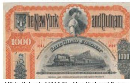
USA: dluhopis $1000 The New York and Putnam Railroad Company

rytin, které byly na sběratelský trh uvolněny během rozprodeje archivu ABN-Co. Jiná možnost je, že nebyly vytvářeny nové rytiny, ale že koláže byly vytvářeny fotomechanickou cestou pomocí kopírování negativů. To by vysvětlovalo případné změny velikostí obrazu včetně faktu, že rytina na některých akcích je mírně menší než rytina na tisícikorunové státočce.