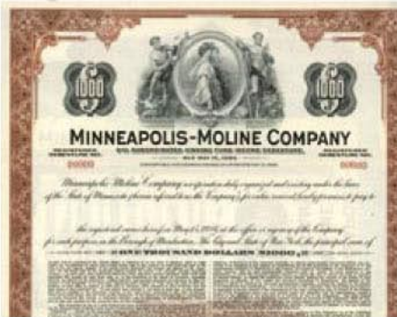
USA: Minneapolis-Moline Company

Rytina většího formátu však našla využití zejména na celé řadě cenných papírů, a to převážně formou ze Spojených států, i když jsou známy výskyty i na akcích formou z některých latinskoamerických zemí. Prvnějším nám známým použitím je na akci Minneapolis-Moline Company z roku 1883. V následující tabulce uvádíme jen některé další příklady. 120