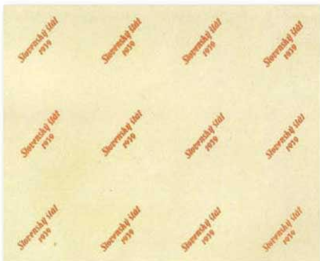
Obr. 1. Ojedinelý nález skúšobnej tlače kníhtlačovej pretlače určenej pre známky „krajiniak“ (č. 13 – 19). Katalóg z roku 2007 jej existenciu predpokladal a ocenil ju symbolom „-“.

Prestaňme však snívať a vráťme sa do reality. Tá totiž tiež občas pripraví prekvapenia na úrovni „zabudnutej truhlice“. Takýmto prekvapivým nálezom v nedávnej minulosti, najmä pre zberateľov povojnového Československa, bol nález celého tlačového listu doplatných známok z roku 1954 s protichodnými dvojicami hodnôt 1.60 a 5 Kč, ktoré boli v minulosti považované za falzifikát vzniknutý zlepením. Ale aj najnovšie číslo Merkur Revue, 6/2013, prináša krásny príklad toho, že proti prekvapivým, v mnohých ohľadoch zásadným objavom nie je imúnna ani táto uponáhlaná a povrchná doba – veď ako inak ako zásadný možno nazvať ústecký falzifikát na škodu