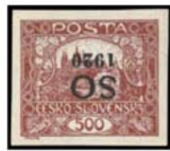
15.ZP 2.TD – příčkový typ 86. pole přetiskové desky: - písmeno „S“ s bodem nahoře. Tato přetisková vada nebyla opravována a vyskytuje se ve všech tvarech přetiskových desek A/1,2,3.

Detail známky z 2. tiskové desky 500 h „Hradčany“ s příčkovým typem na 15.ZP, vyskytující se na známce s převráceným černým přetiskem „SO 1920“.